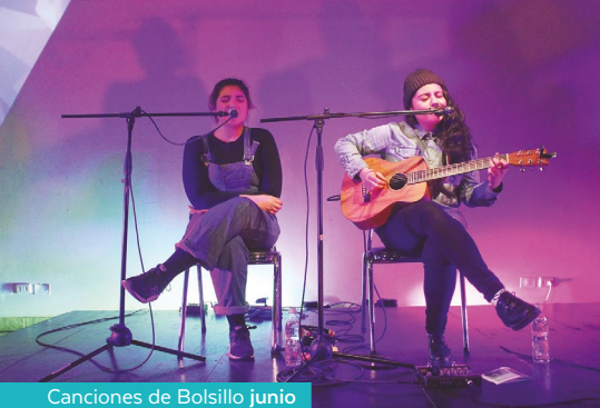
Canciones de Bolsillo junio